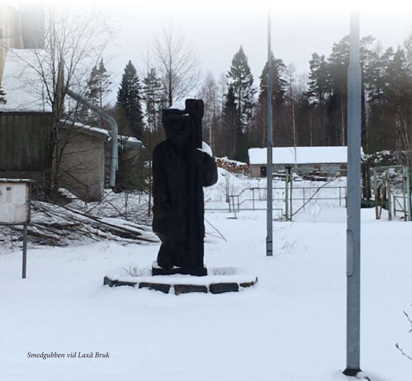
Smedgubben vid Laxå Bruk

Enkätsvaren har sammanställts och har nyttjas för att utforma denna utvecklingsplan och avsnittet om utvecklingsområden.