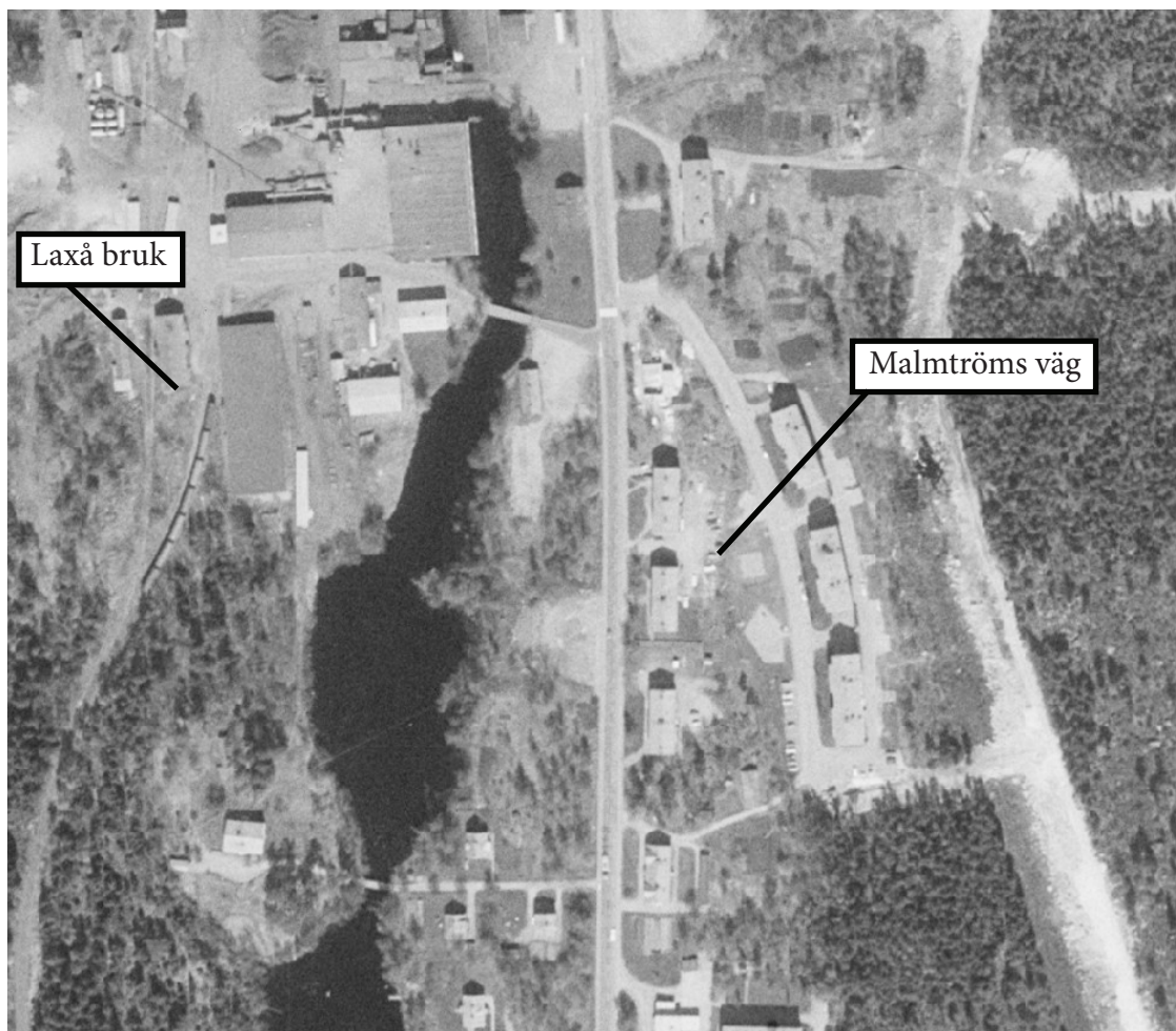
Ortfoto 1975. Flerbostadshus vid Malmströms väg

I centrala Rölfors finns byggbar mark som skapar möjlighet till bebyggelseutveckling inom orten. Området har tidigare varit bebyggt med flerbostadshus på den gata som hette Malmströms väg. Dessa byggnader revs mellan 2005-2006. På denna plats finns rester av den infrastruktur som byggdes ut för flerbostadshusen. Området är inte detaljplanlagt.